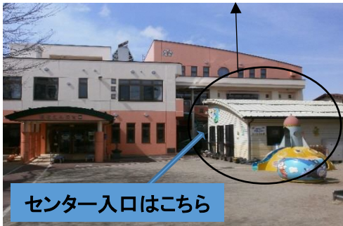
センター入口はこちら