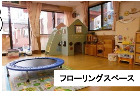
フローリングスペース