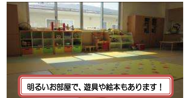
明るいお部屋で、遊具や絵本もあります！

今年度も毎月、身長、体重の計測を行います。センターで記録カードを準備しています。お気軽においでください。月齢が低いお友達でも測定できます。お子様の成長を喜びあいましょう！